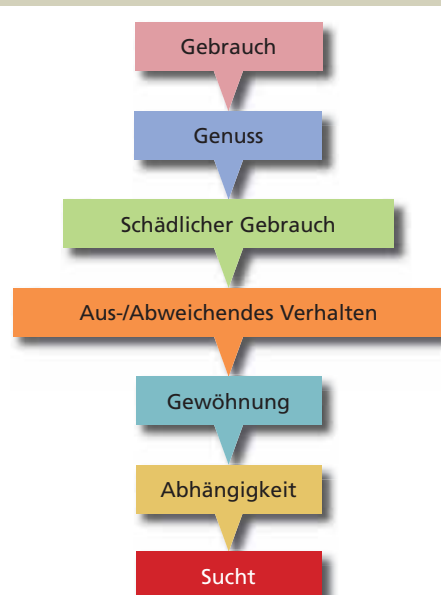
Abbildung 1 Der Weg vom Gebrauch in die Sucht

* Bei einigen der angeführten Abhängigkeiten – nicht zuletzt bei der Spielsucht – werden in der Literatur auch andere Mechanismen wie etwa Impulskontrollstörungen oder Zwangserkrankungen ätiologisch diskutiert