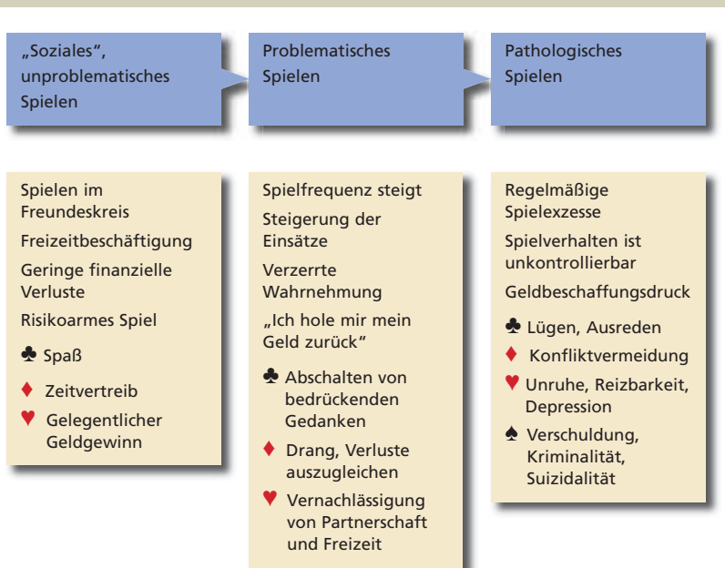
Abbildung 2 Entwicklungsverlauf zum pathologischen Spielen

Sehr häufig lassen sich für den Beginn der Phase des problematischen Spielens auslösende Faktoren identifizieren.