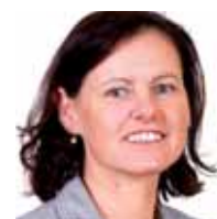
DGKS Dora Mair Neurourologische Ambulanz, Universitätsklinik für Neurologie, Innsbruck